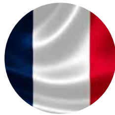
FRANCIA Primer Lugar

Incluye: Vuelos, hospedaje, alimentación y transporte en el lugar seis días y cinco noches.