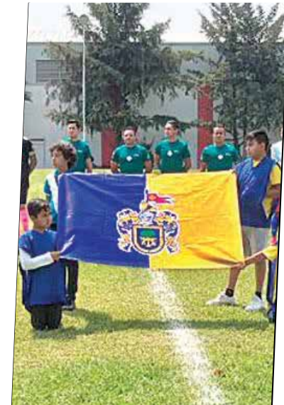
Copa Jalisco 2021