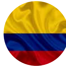
COLOMBIA Segundo Lugar